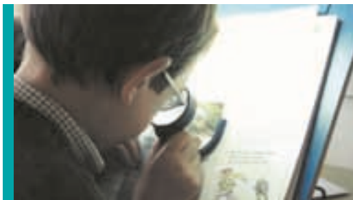
Observación con lupa

Cabe destacar el papel relevante del profesorado que incide directamente en el proceso formativo del alumno/a. Desarrolla su función de mediación en su proceso de aprendizaje, contribuyendo a la normalización de su vida escolar mediante el ajuste de la respuesta educativa con el diseño y desarrollo de la adaptación curricular correspondiente.