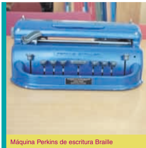
Máquina Perkins de escritura Braille

Entre las funciones del Equipo y de los profesionales que, desde la O.N.C.E. las apoyan, destacamos las siguientes: