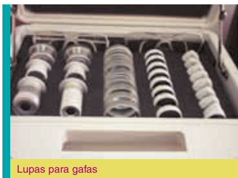
Lupas para gafas