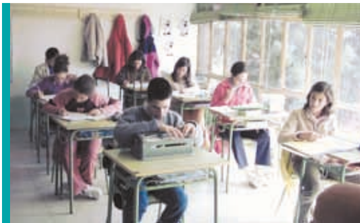
Trabajando en clase

No existen unas manifestaciones comportamentales uniformemente presentes en todos los niños y niñas deficientes visuales, si bien suelen presentarse, con relativa frecuencia, ciertos rasgos de comportamiento.