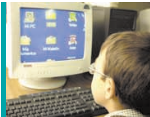
Ampliaciones en el ordenador

Esta necesidad se acentúa en los alumnos y alumnas con déficit visual. La presencia de resto visual hace que no se identifiquen como personas con déficit, lo que en muchos casos, conlleva el rechazo de las ayudas y programas educativos que compensarían las necesidades educativas que presentan.